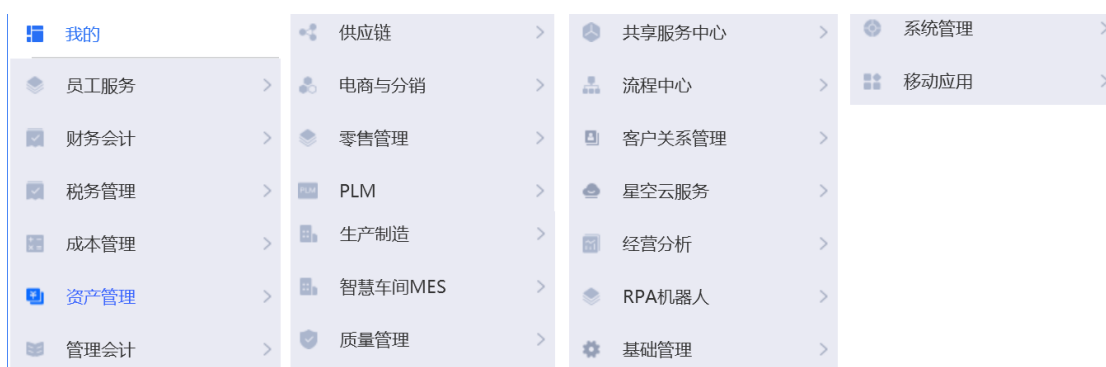
国塑数字化综合管控系统-菜单

在工作和生产中践行绿色环保理念。在办公区域，倡导节约用电用水，定期维护办公设备，控制办公用品采购，培养员工人走灯灭、人走水停、人走关机、空调不低于 26℃ 等习惯，推动云办公，提升信息传递效率，减少纸张浪费，并培养员工日常工作中的节约意识，做到物尽其用，减少资源浪费。